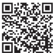
申込フォームQRコード